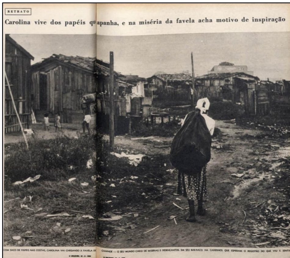
Imagem 02: publicação sobre a vida de Carolina Maria de Jesus, no jornal “O Cruzeiro.”