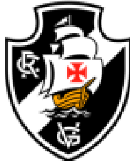
Figura 2: Escudo do Club de Regatas Vasco da Gama