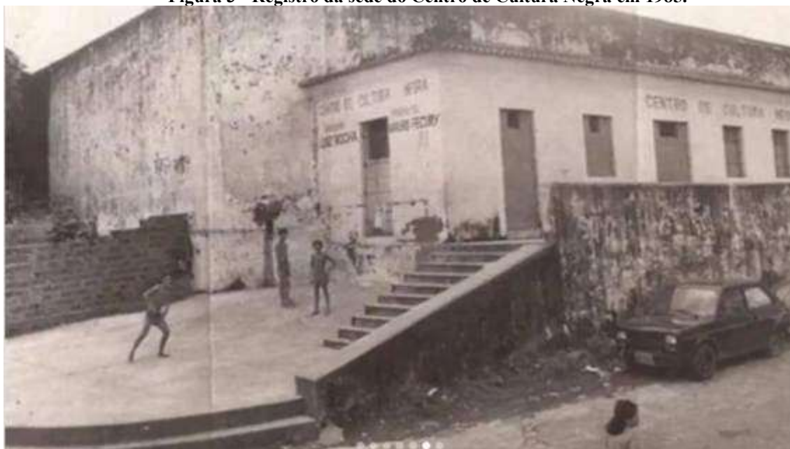
Figura 3 - Registro da sede do Centro de Cultura Negra em 1985.