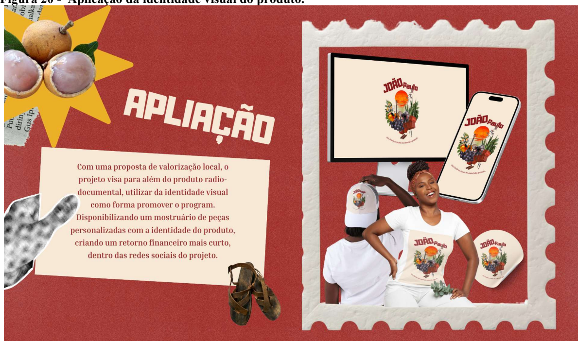
Figura 20 - Aplicação da identidade visual do produto. 50