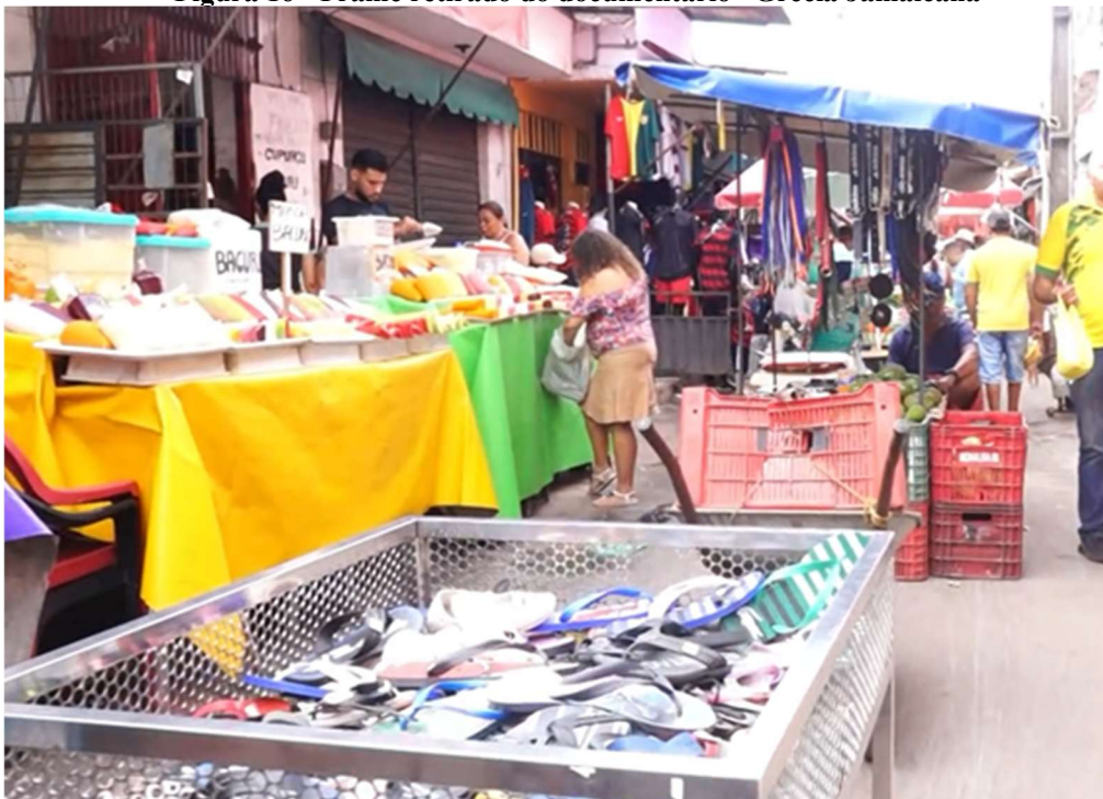
Figura 16 - Frame retirado do documentário “Grécia Jamaicana”