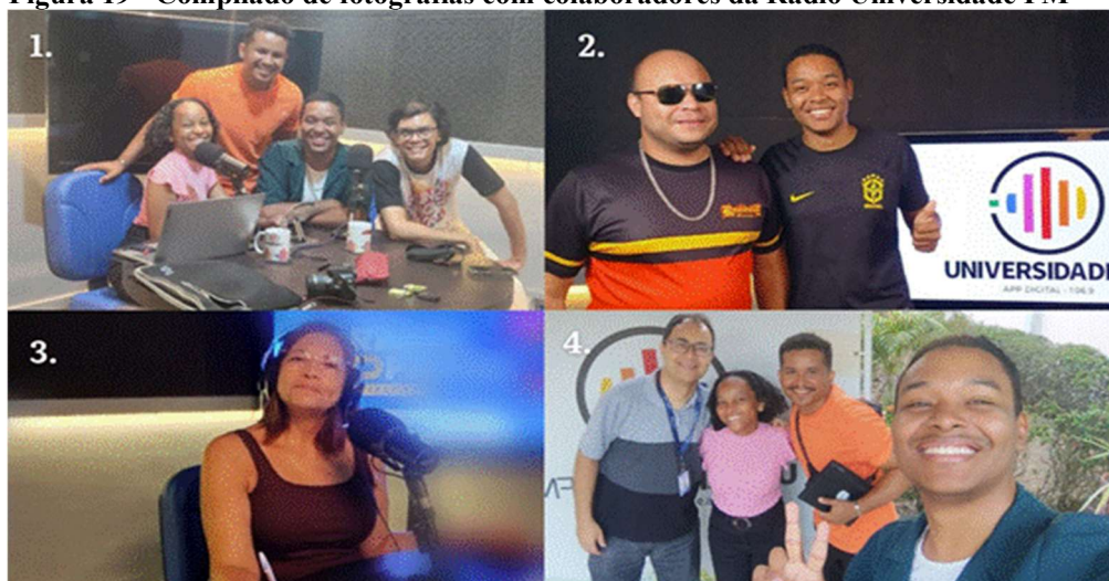
Figura 19 - Compilado de fotografias com colaboradores da Rádio Universidade FM