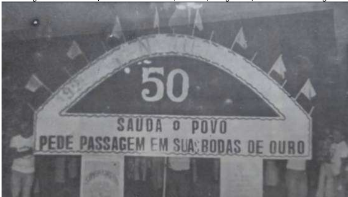
Figura 4 Comemoração de Bodas de Ouro, em 1979, da agremiação "Turma da Mangueira."