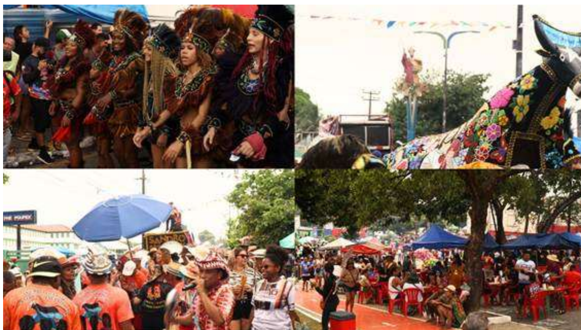
Figura 5 - Frames retirados de vídeos que registraram a festa de São Marçal de 2025.