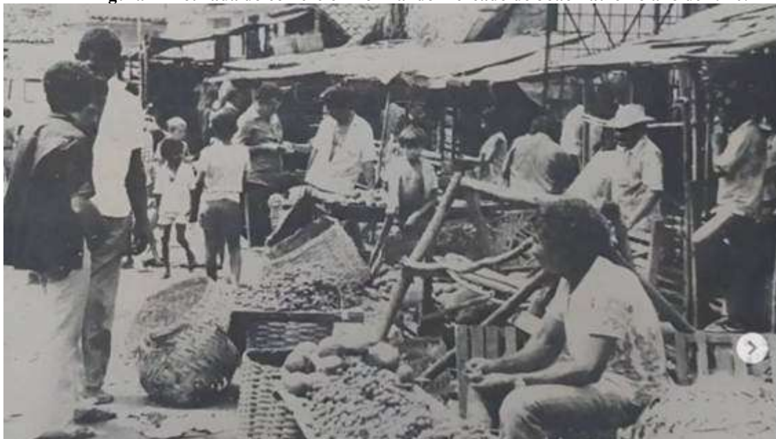
Figura 2- Retirada do comércio informal do mercado do João Paulo no ano de 1970.