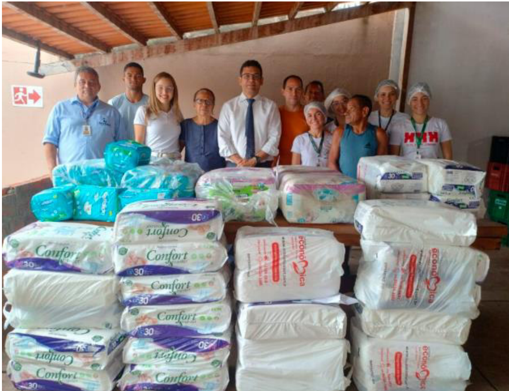
Figura 4 – Entrega de fraldas geriátricas às ILPIs Lar São Francisco e Lar Renascer, Imperatriz/MA.