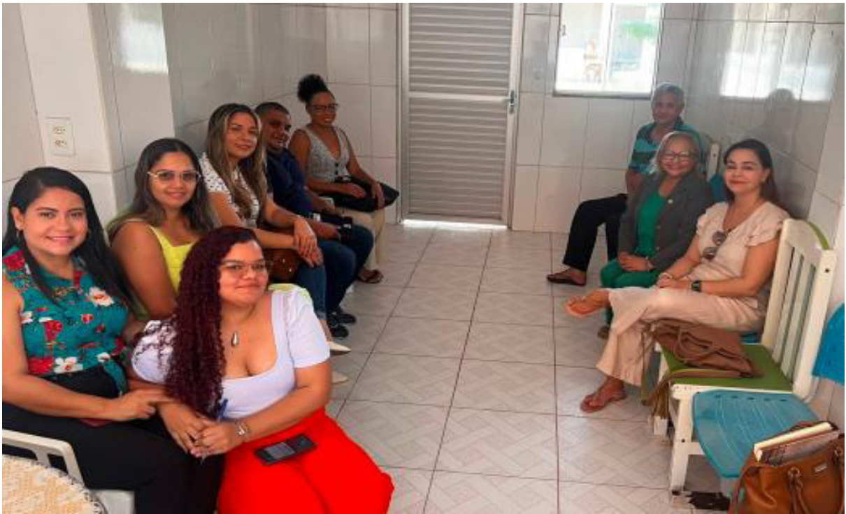
Figura 2: Visita institucional do MPMA a ILPI Lar São Francisco em 22 de setembro de 2025