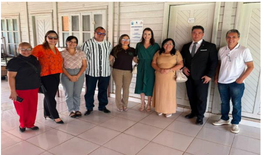
Figura 1: Visita institucional do MPMA a ILPI Lar Renascer em 22 de janeiro de 2025

Nesse contexto, apresenta-se imagens referente à visita institucional realizada pelo Ministério Público do Estado do Maranhão, por meio da 4ª Promotoria de Justiça Especializada de Imperatriz/MA, às Instituições de Longa Permanência para Idosos Lar São Francisco, Lar Renascer e a Vila João XXIII, evidenciando o cumprimento das determinações legais e o exercício da função fiscalizatória atribuída ao órgão ministerial.