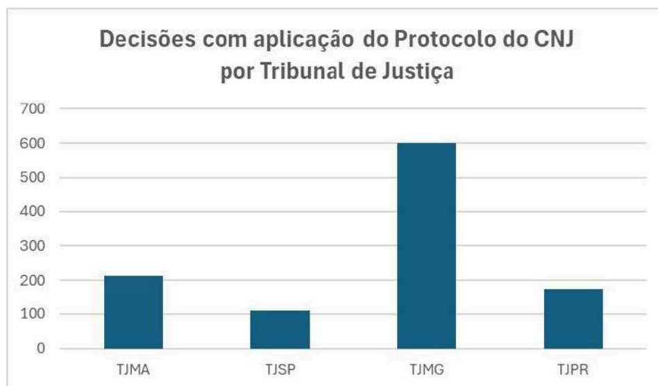
Gráfico 2 - Decisões com aplicação do Protocolo do CNJ por Tribunal de Justiça brasileiro

com 18 decisões específicas sobre o tema. Esse dado sugere que, além da violência doméstica, outros temas do Direito Civil, como a dissolução de vínculos conjugais, também têm recebido atenção quanto à perspectiva de gênero, embora ainda em menor escala (Gráfico 2).