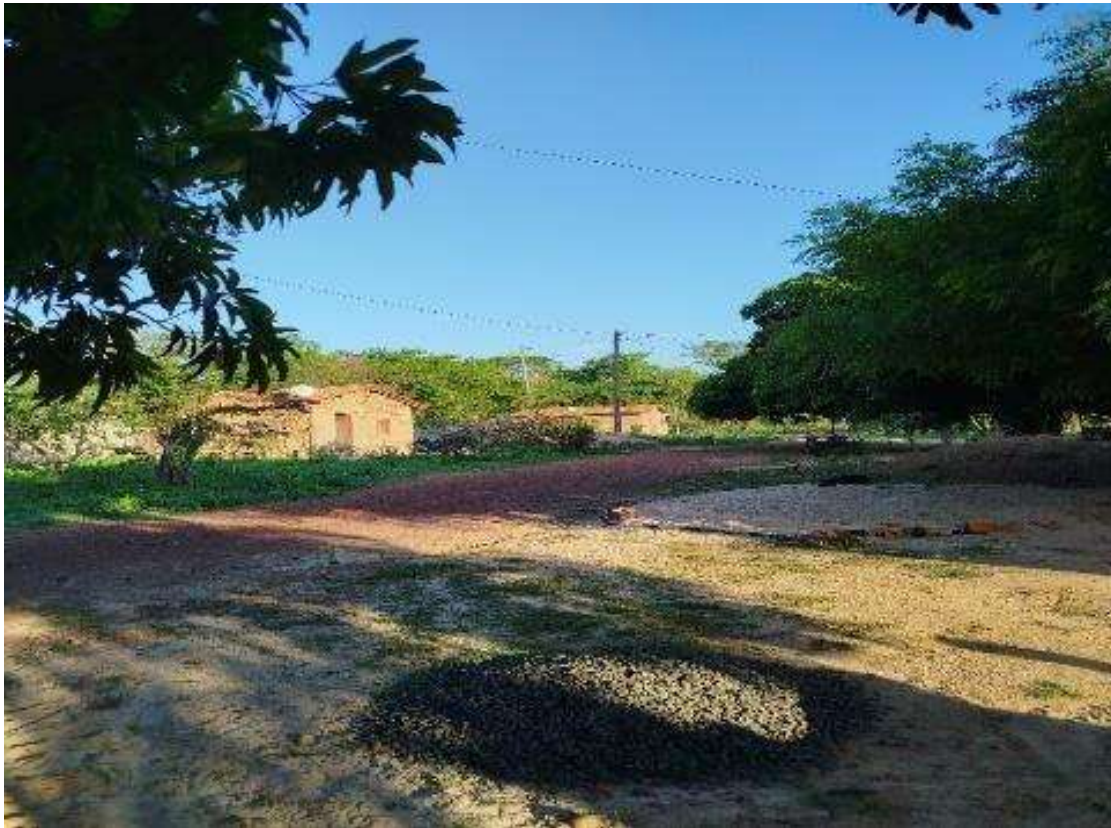
Figura 1- Vista geral da Comunidade Quilombola Mamorana

A pesquisa adota uma abordagem qualitativa, uma vez que busca compreender a complexidade dos conflitos agrários vivenciados pela Comunidade Quilombola Mamorana (Figura 1) a partir das percepções, experiências e narrativas dos sujeitos envolvidos.