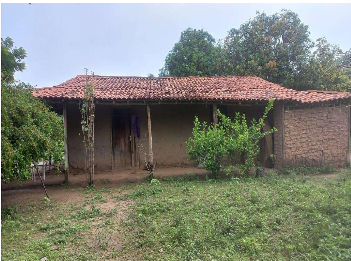
Figura 2: Habitação na Comunidade Quilombola Mamorana

No que se refere aos procedimentos técnicos, foram empregadas estratégias de coleta e análise de dados. Inicialmente, realizou-se uma revisão bibliográfica sobre conflitos agrários, territorialidade e comunidades tradicionais, conforme orientam Lakatos e Marconi (2017), incorporando autores de referência no debate sobre território e disputas no campo. Observações em campo foram fundamentais para melhorar o entendimento de aspectos como moradia em um território quilombola (Figura 2).