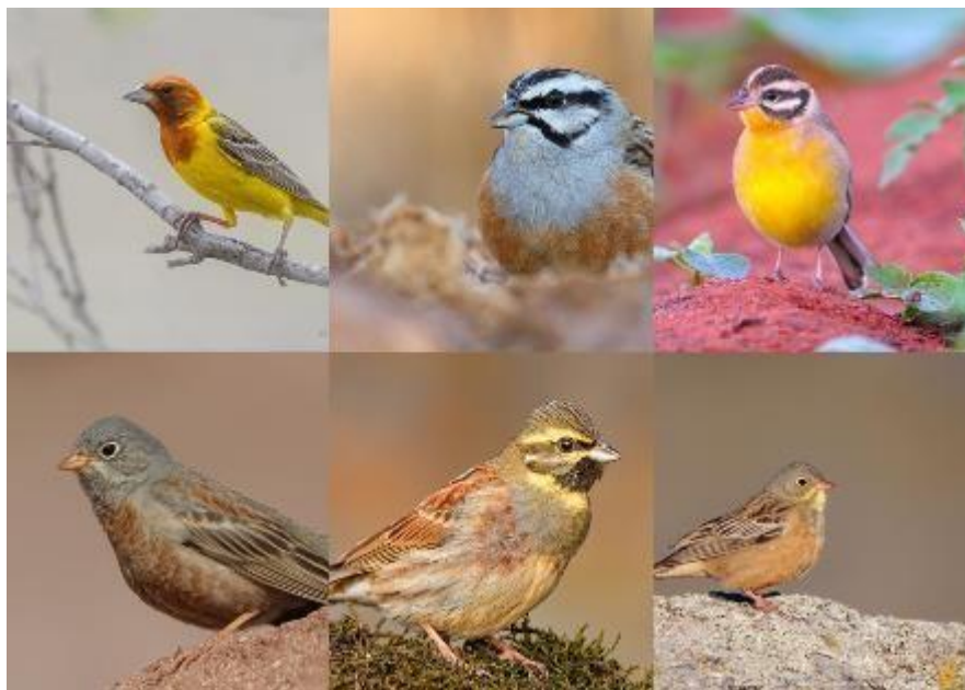
Figura 1 – Exemplos de aves da Família Emberizidae

onde diversas condições favorecem a continuidade dessa prática, incluindo aspectos econômicos e sociais. Entre as aves mais comercializadas ilegalmente estão as da família Emberizidae (Figura 1).