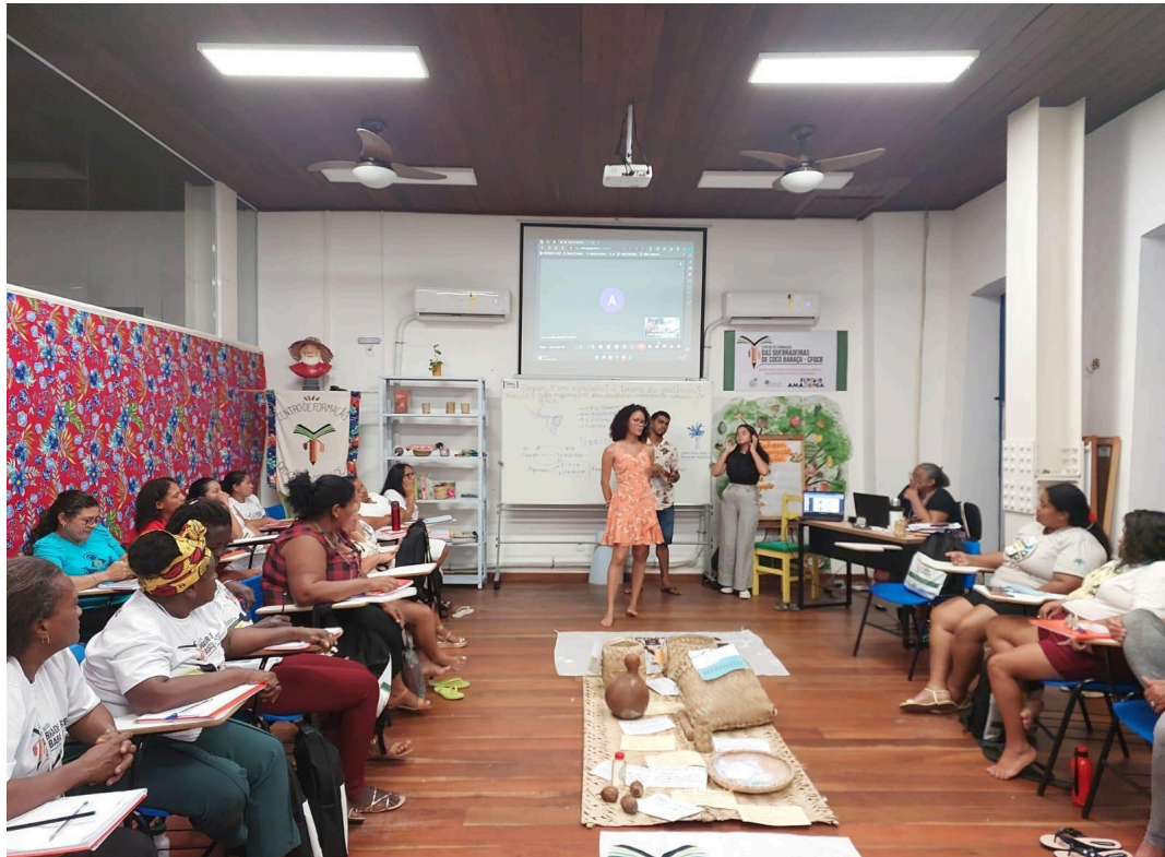
IMAGEM 3: Momento de discussão.