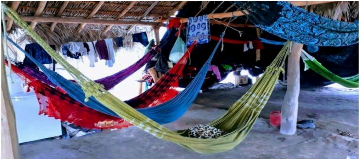
IMAGEM 1: Área da fazenda onde foram encontrados os trabalhadores.