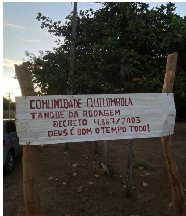
IMAGEM 4 : Entrada do território de Tanque da Rodagem e São João