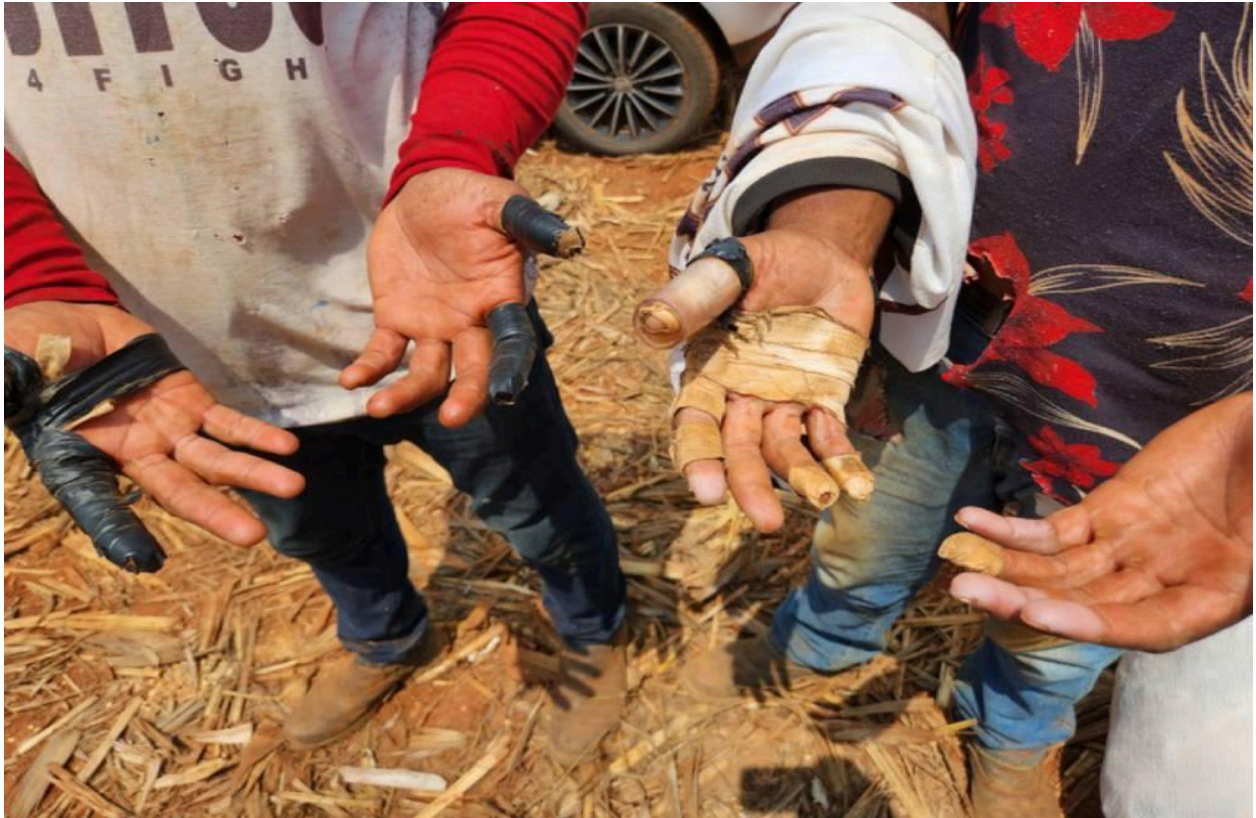
IMAGEM 2: Trabalhadores resgatados mostram as mãos feridas devido à falta inclusive de equipamentos de proteção individual.