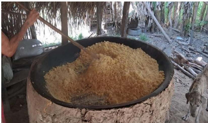
Figura 4: Produção de farinha no povoado Baixinho

Essa experiência celebra o que o escritor malinês Hampaté Bâ (2010, p. 168) apresenta ao ressaltar o pilar ancestral da palavra e a ligação dela com o homem em África: “A própria coesão da sociedade repousa no valor e no respeito pela palavra”. Sem dúvida, a oralidade é um organismo vivo e fundamental em terras de Camaputiua, onde a ancestralidade africana é evidente. Na comunidade Santa Severa, há ruínas de um antigo engenho, um elo entre o passado e o presente, fato que os moradores mostram com orgulho destacando as evidências do trabalho de seus antepassados escravizados, que lutaram para que hoje seus descendentes sejam livres. O território de Camaputiua é cercado pela natureza e os modos de vida de seus moradores estão ligados à biodiversidade regional, sendo o extrativismo de babaçu uma prática comum, que valoriza e preserva o meio ambiente, uma vez que o consumo dos subprodutos da palmeira de babaçu é sustentável, visando à reprodução social e humana que ultrapassa as lógicas capitalistas do grande mercado. Os saberes ligados às principais atividades econômicas são ensinados desde cedo, o que proporciona uma consciência observada desde a infância, traço comum em todas as 10 comunidades visitadas.