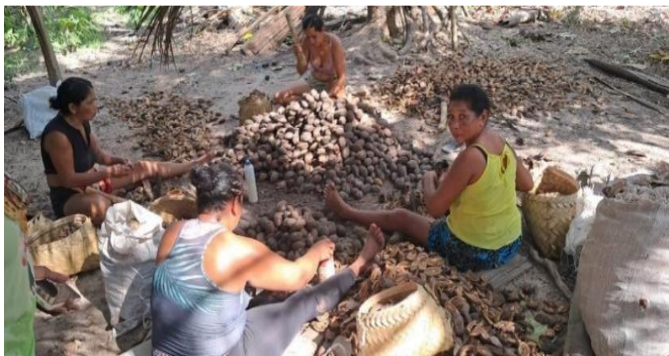
Figura 5: Quebradeiras de coco babaçu em atividade

O movimento tem caráter associativo, não tem fins econômicos e é coordenado e dirigido por uma comissão de mulheres quebradeiras de coco, eleitas em Assembleia Geral Ordinária realizada a cada quatro anos. A principal missão do movimento tem sido “organizar as quebradeiras de coco babaçu para conhecer e defender seus direitos, promover sua identidade, autonomia política e econômica, lutar por terra, territórios coletivos e babaçu livre construindo o bem viver”. A organização também luta pelo direito à terra, pela agroecologia e por uma economia que valorize o trabalho da mulher (MIQCB, 2023).