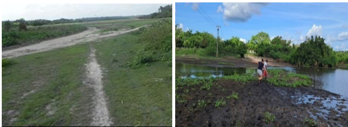
Figuras 2 e 3: Campos secos e alagados na região

A Baixada Maranhense, onde se localiza Camaputiua, é uma microrregião cercada por campos alagados, que se formam durante o período das chuvas, entre janeiro e junho, e, no período do verão, dão espaço a estradas de terras, um fenômeno do bioma desta localidade chamado de “Pantanal Maranhense”. O território é amplo e de difícil acesso para algumas comunidades, que se deslocam usando canoas, motos, carros e a pé, a depender do período de seca ou de chuvas.