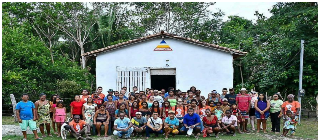
Figura 6: Moradores em frente à AMQRIC

Os quilombolas de Camaputua destacam que demandam apenas políticas públicas que promovam os seus direitos enquanto cidadãos; querem ser respeitados e valorizados enquanto povos tradicionais dotados de conhecimentos e saberes que atravessaram o Atlântico e encontraram morada em solo brasileiro. Essas informações emergiram no local onde ocorreram as assembleias e oficinas realizadas com as comunidades - a Associação de Moradores do Quilombo Rural da Ilha de Camaputua, que fica localizada na comunidade do mesmo nome, Ilha de Camaputua. Ela já é um ponto de encontro que conecta todas as 28 comunidades quando há reuniões entre as lideranças e diversas outras ações que precisem dessa base de apoio. Para registrar a participação das comunidades e a importância dessa associação, segue imagem abaixo.