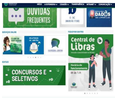
Figura 3 Imagem da interface do site da Defensoria do Estado do Maranhão

Além disso, a entrada do núcleo de atendimento também se revela desafiadora para indivíduos com dificuldades de locomoção. A necessidade iminente de implementação de rampas e corrimãos torna-se evidente, visando proporcionar um acesso mais facilitado e inclusivo.