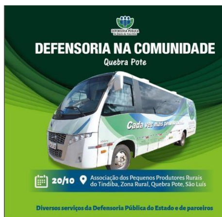
Figura 10