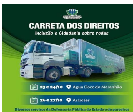
Figura 8

O Ônibus-Escritório, uma unidade móvel que integra o projeto "Defensoria na Comunidade" desde junho de 2018, destaca-se por levar ações diretamente aos conglomerados habitacionais da capital e interior do estado. Essa iniciativa visa proporcionar acessibilidade aos serviços da Defensoria Pública, atendendo às demandas das comunidades de maneira mais próxima e facilitada.