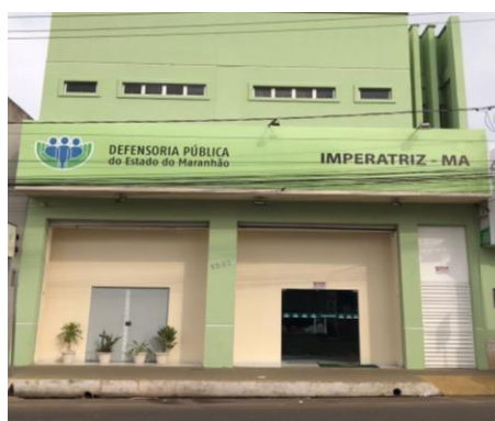
Figura 4 Faixada da Defensoria Pública de Imperatriz-MA

A infraestrutura do local apresenta limitações significativas em termos de acessibilidade para pessoas com mobilidade reduzida. Notavelmente, a ausência de um elevador ou de uma pista específica para cadeirantes impede o acesso ao segundo andar, onde estão localizados alguns dos setores de atendimento. Diante dessa situação, os profissionais são obrigados a descer para o térreo e conduzir as consultas em salas disponíveis nesse piso.