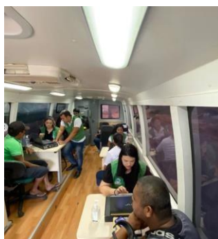
Figura 14

A Carreta dos Direitos, assim como o Ônibus da Defensoria Pública na Comunidade, integrantes do projeto "Inclusão e Cidadania sobre Rodas" da Defensoria Pública, é apresentada como uma iniciativa abrangente que percorre todos os municípios, visando ampliar os serviços oferecidos pela instituição. No entanto, é imprescindível analisar a eficácia dessa ação itinerante. Embora tenha sido destacado o expressivo número de atendimentos realizados em determinados municípios, é necessário questionar a profundidade e a sustentabilidade dessas