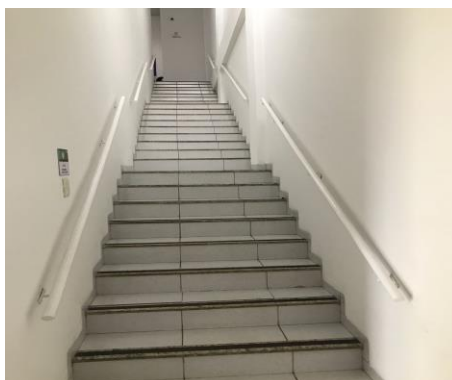
Figura 5 Escada de acesso ao segundo piso da Defensoria Pública de Imperatriz-MA

Essas questões relacionadas à acessibilidade comprometem a eficácia do serviço prestado e ressaltam a urgência de medidas corretivas. É imperativo que sejam implementadas soluções estruturais que garantam a plena acessibilidade a todos os usuários, promovendo assim um ambiente mais inclusivo e respeitoso.