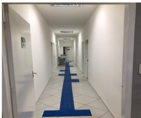
Figura 2 Defensoria Pública de Imperatriz-MA, Recepção térreo, pisos táteis direcionais