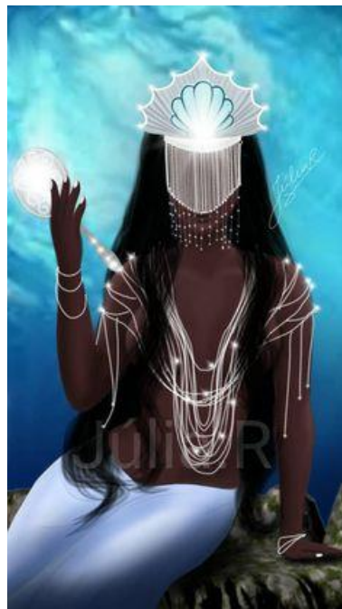
2 Yemanjá. A ilustração ressalta as características étnicas africanas.

Vejamos o relato de uma entrevistada 12 sobre o a lenda da mãe d'água: