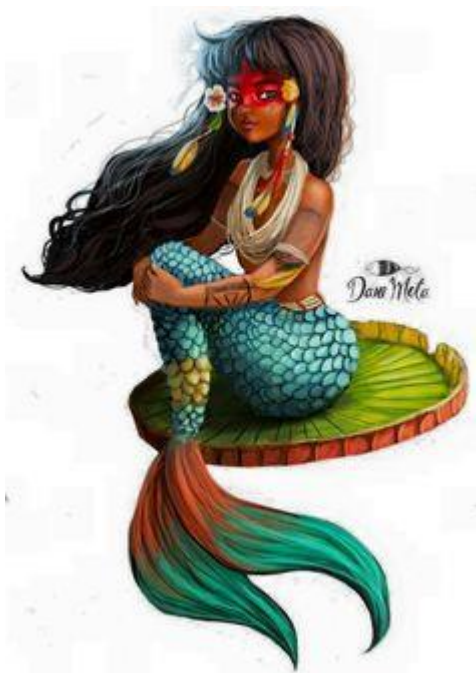
1 Iara, Dona das águas. Representação sob os traços indígenas da variação étnica do mito.