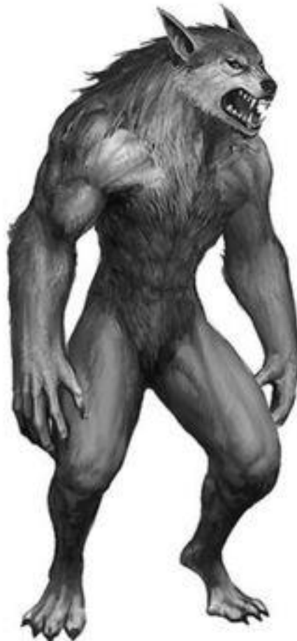
3 Lobisomem ( Ilustração).

Para a imaginação ocidental, o lobo é o animal feroz por excelência. Temido por toda Antiguidade e a Idade Média, volta aos tempos modernos periodicamente para se reencontrar em algum animal do Gévaudan, e nas colunas dos nossos jornais constitui o equivalente mítico e invernal das cobras do mar estivais (DURAND, 1997, p. 86).