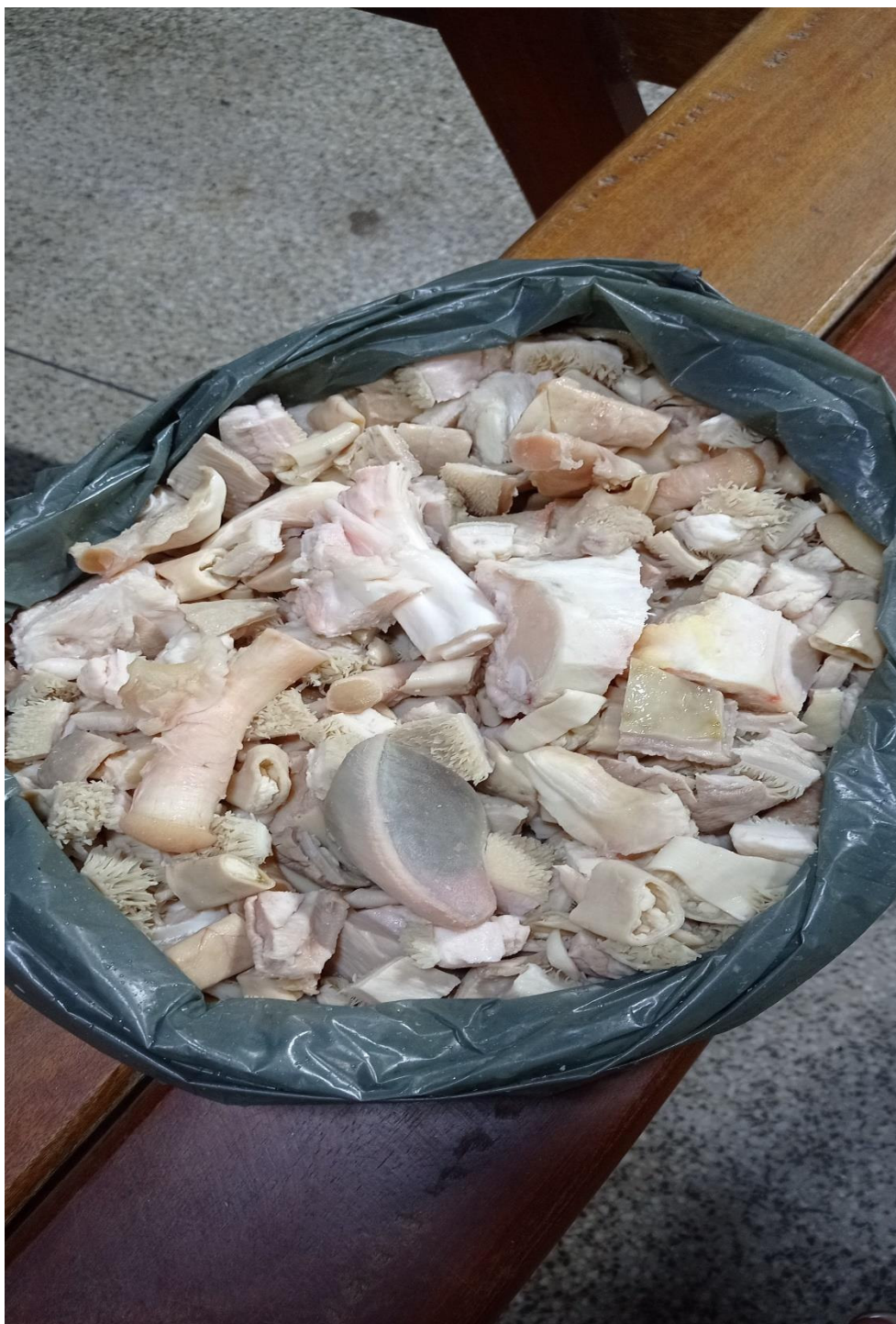
Fig. 12: Imagem da panelada após o processo de Limpeza