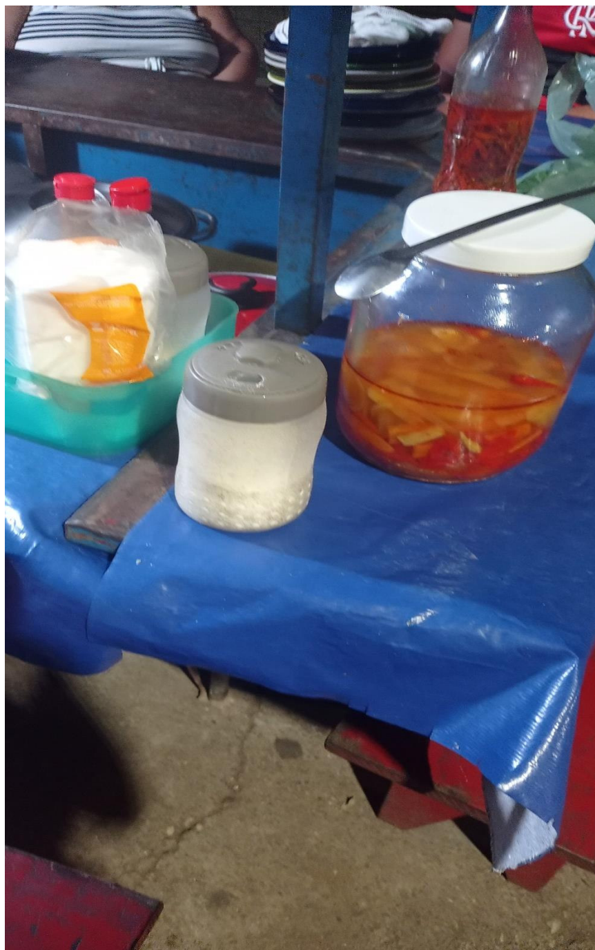
Fig. 15: Acompanhamentos da panelada