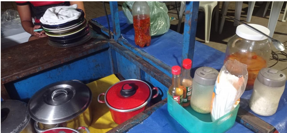
Fig. 11: Detalhe do carrinho de panelada utilizado nas quatro bocas