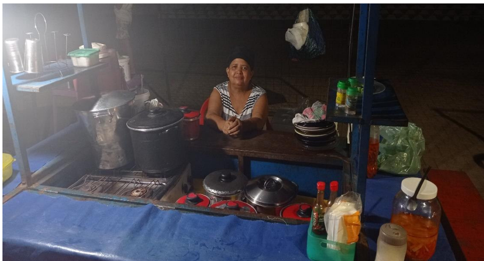
Fig. 1: Registro com a nossa primeira entrevistada