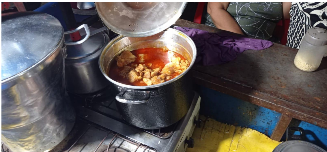
Fig. 13: Imagem da panelada pronta.