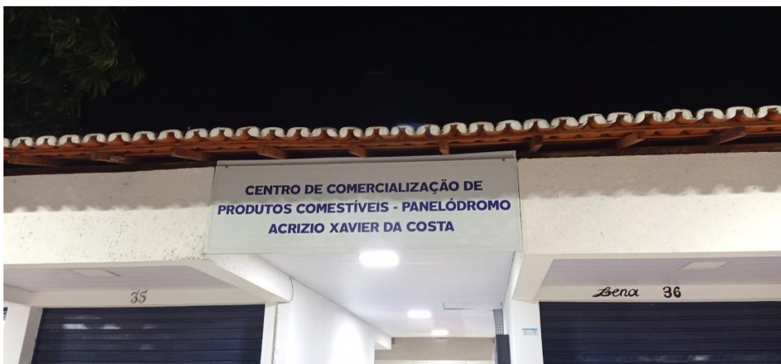
Fig. 9: Detalhes do novo panelódromo