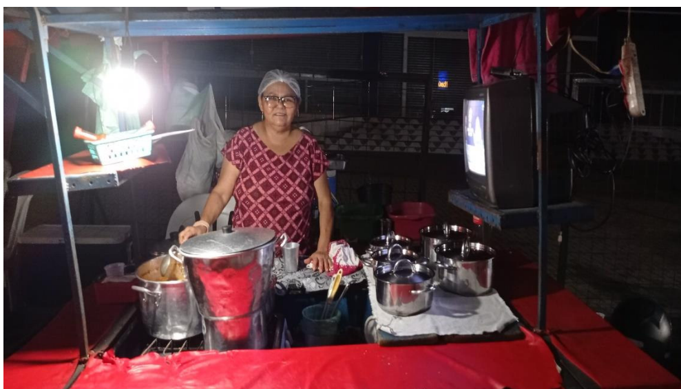
Fig. 3: Registro com a terceira entrevistada