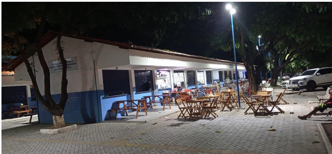
Fig. 8: Imagem do novo panelódromo de Imperatriz