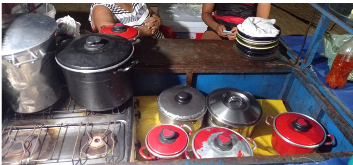
Fig. 14: foto aberta do carrinho de panelada antes do início das vendas.