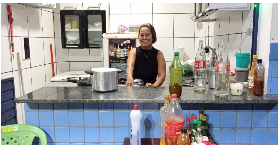
Fig. 2: Registro com a nossa segunda entrevistada