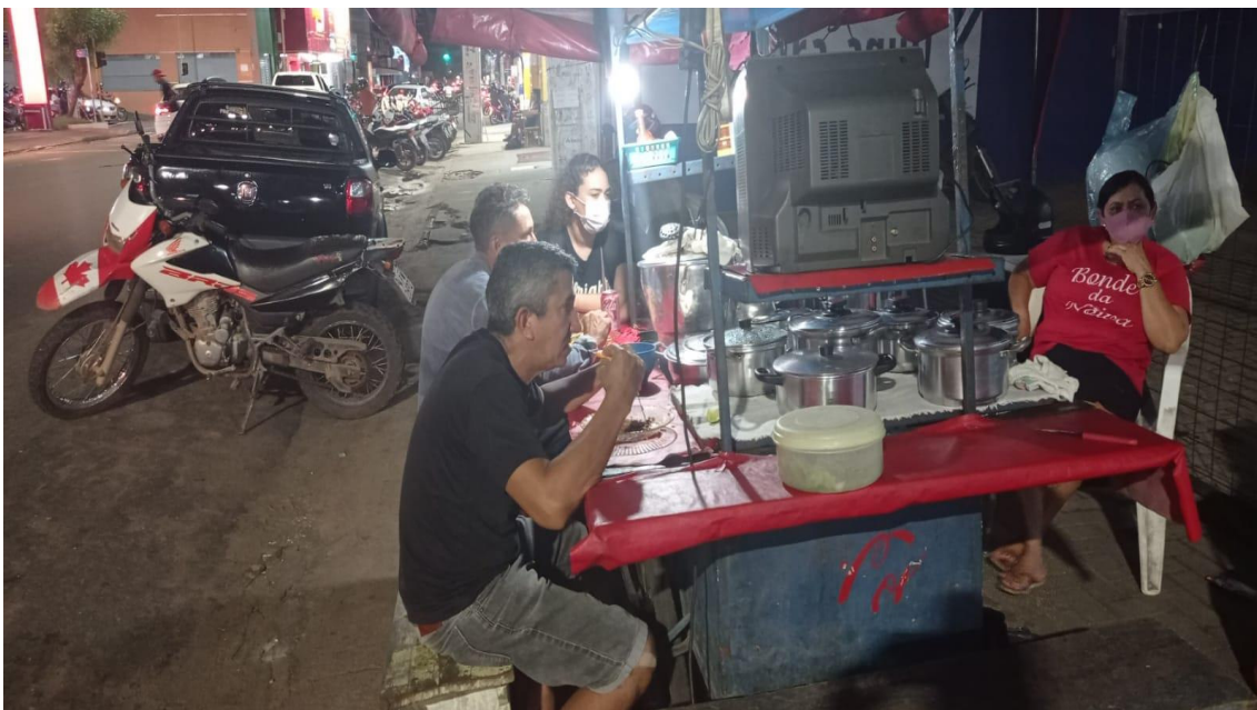
Fig. 16: Clientes consumindo panelada nas quatro bocas