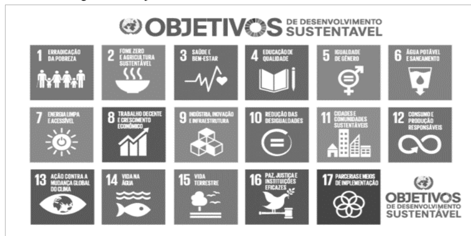
Figura 2 – Objetivos de Desenvolvimento Sustentável da ONU

Outra etapa importante foi a proposição pela ONU em 2015 da Agenda 2030 - “Transformando Nosso Mundo” com seus 17 Objetivos de Desenvolvimento Sustentável (ODS) contemplando a erradicação da pobreza e a vida digna para todos no planeta, estabelecendo um plano de ação para guiar a comunidade internacional para ações sustentáveis. A Figura 2 apresenta os 17 ODS. A anuência dos países à Agenda 2030 representa o compromisso com o Desenvolvimento Sustentável.