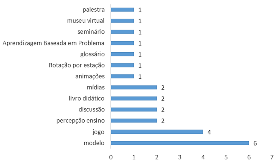
Figura 02: Objetos de estudo presentes nos artigos analisados sobre embriologia publicados entre os anos de 2010 a 2022.

O uso de Jogos representa o segundo mais analisado dentre os objetos de estudo. Casas e Azevedo (2017), Alves et al. (2020), Costa et al. (2020), Santos et al. (2014) examinam os jogos, analisando a execução e utilidade como potencializadores do ensino de embriologia. Três deles abordam a embriologia humana, e um aborda a embriologia comparada.