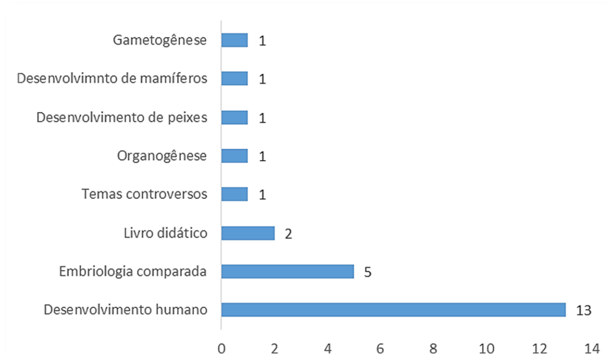
Figura 01 - Temas abordados em embriologia presentes nos trabalhos analisados publicados entre os anos de 2010 a 2022

A embriologia comparada é a segunda temática mais abordada nos trabalhos analisados. Foram encontrados 5 artigos, três voltados para o ensino superior e dois para o médio. Assunção e Miglino (2020) relatam que o estudo da embriologia comparativa é fundamental na formação de futuros profissionais tanto da área da saúde quanto das agrárias e/ou biológicas.