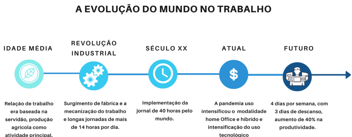
Figura 1 - Evolução do mundo no trabalho

Inicialmente, nas primeiras formas de trabalho, não havia uma jornada de trabalho definida. Durante a Idade Média, o trabalho era amplamente caracterizado pelo sistema feudal, no qual a maior parte das atividades laborais era agrícola e realizada nos feudos. Nesse contexto, os senhores feudais ofereciam terras aos servos em troca de uma porção significativa da produção agrícola.