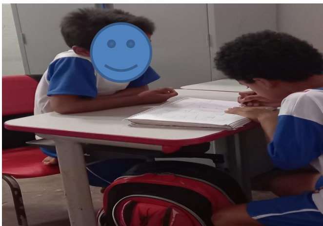
Figura 2 – Meninos brincando de forca.