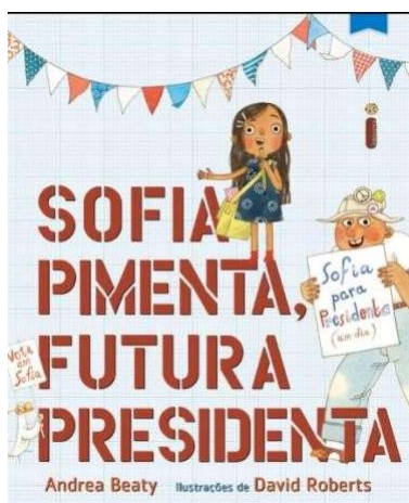
(Capa do livro Sofia Pimenta – Futura Presidenta , de Andrea Beaty, 2019)