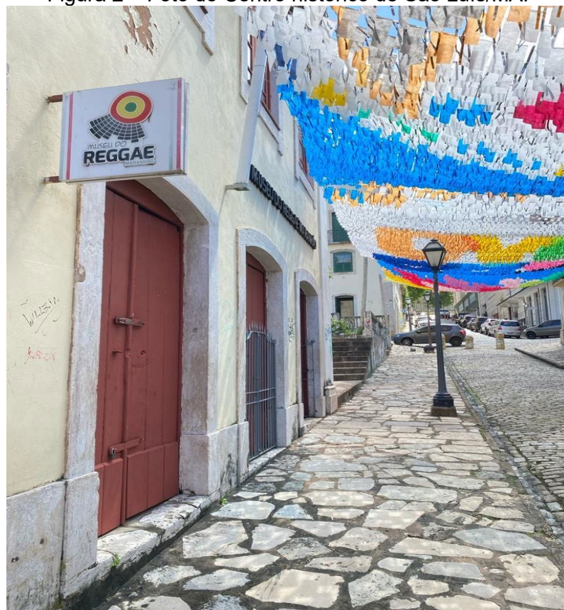
Figura 2 – Foto do Centro histórico de São Luís/MA.

Com a concessão do título em 1997 pela UNESCO, foram iniciadas nos anos seguintes mais obras, em especial, no perímetro do espaço urbano reconhecido pela UNESCO, possibilitando uma ampla recuperação da infraestrutura urbana de uma área com 60 hectares.