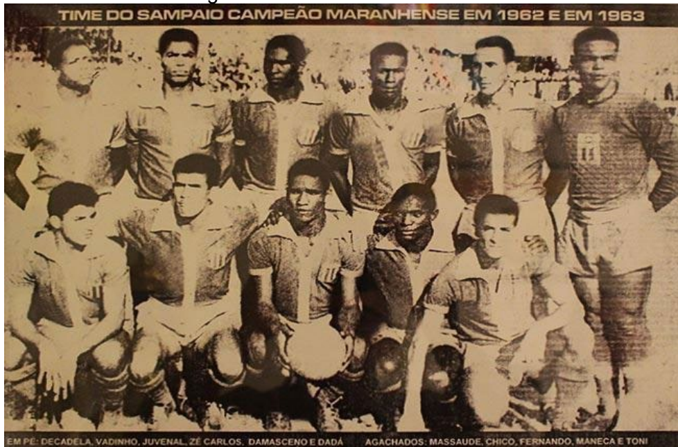
Figura 3 – Primeira foto do Clube.