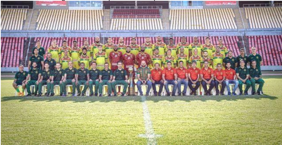
Figura 4 – Conquista do campeonato maranhense.