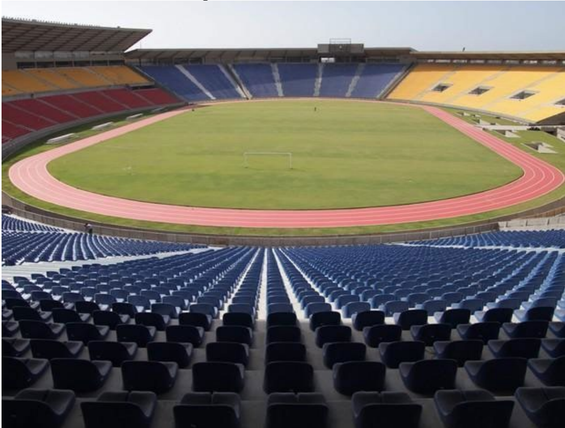
Figura 6 – Estádio Castelão.