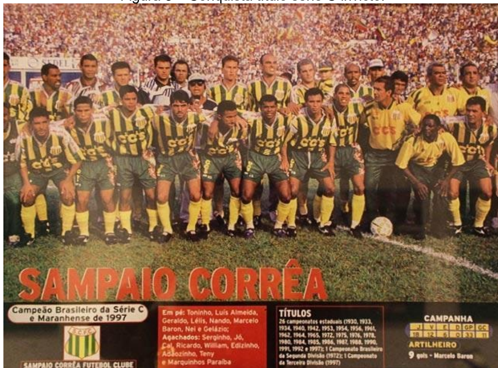
Figura 5 – Conquista título série C invicto.